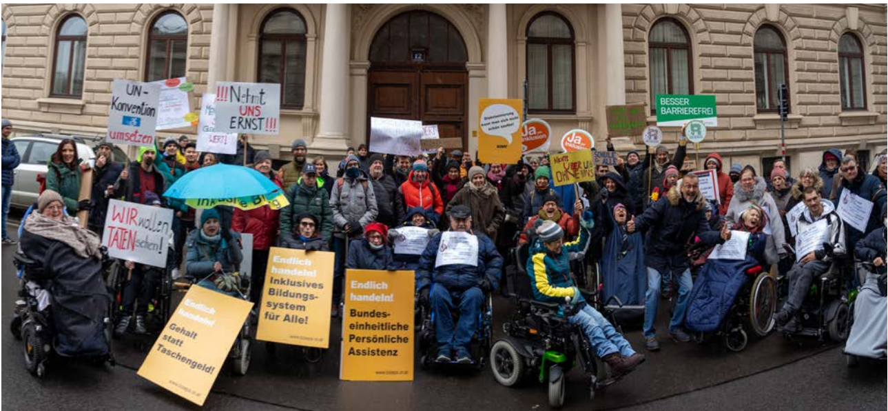
Übergabe eines Forderungspakets an Vertreter*innen der GRÜNEN in der Wiener Löwelstraße am 2. Dezember 2022

Die Lesung erfolgte in verschiedenen Formaten wie Lautsprache, Braillezeile, Einfacher Sprache sowie in der Österreichischen Gebärdensprache. Ergänzt wurde die Veranstaltung durch die Installation mit dem Titel „Baustelle Inklusion“. Diese wies mit symbolischen Werkzeugen auf die noch offenen Aufgaben in der Gleichstellungspolitik hin und unterstrich die Bedeutung der Konvention als verbindliche Grundlage für staatliches Handeln.