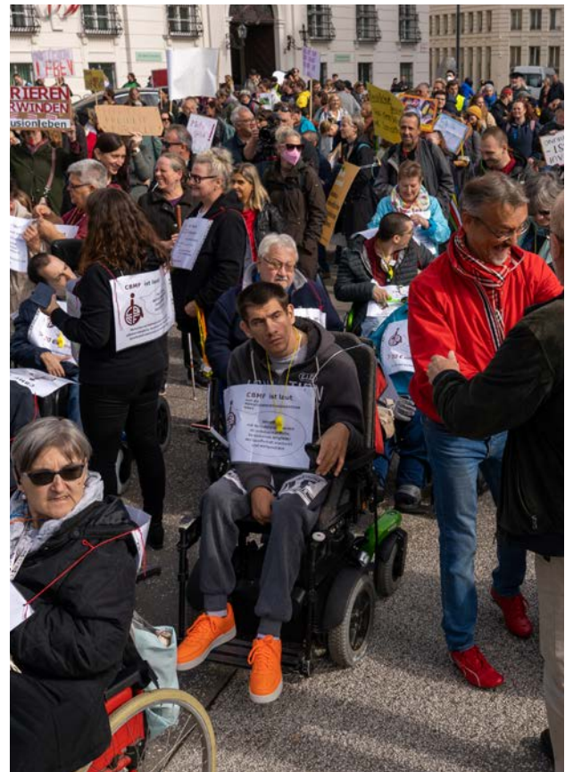
Kundgebung am Wiener Heldenplatz.

Ein Jahr später, am 27. Oktober 1992 , folgte eine große gemeinsame Kundgebung am Ballhausplatz. Diese dokumentierte die Geschlossenheit der gesamten Behindertenbewegung vor dem Bundeskanzleramt und ebnete den Weg für das im Jahr 1993 beschlossene Bundespflegegeldgesetz.