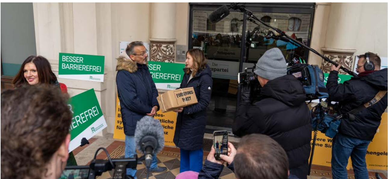
Übergabe eines Forderungspakets an Vertreter*innen der ÖVP in der Wiener Lichtenfelsgasse am 2. Dezember 2022