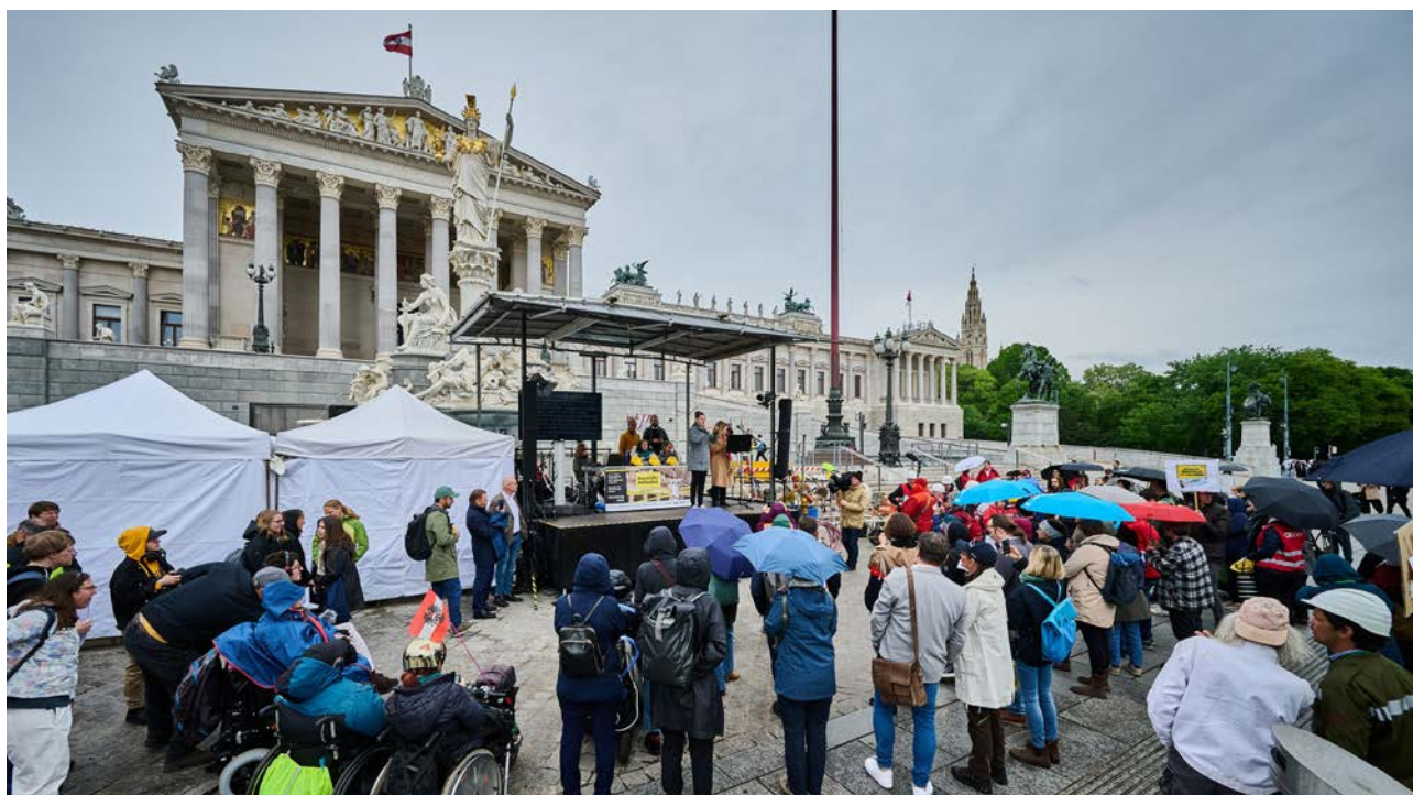
Eröffnung der Baustelle Inklusion am 5. Mai 2025 vor dem Parlament.

Die Jahre bis zum Jubiläum 2026 waren von einer verstärkten öffentlichen Sichtbarkeit durch Mahnwachen, Demonstrationen und Inklusionsmärsche geprägt. Ein Höhepunkt war dabei die zehnstündige Lesung der UN-Behindertenrechtskonvention am 5. Mai 2025, dem Europäischen Tag der Menschen mit Behinderungen, in die diese Protestformen mündeten. Mit der gesetzlichen Verankerung und der innerorganisatorischen Reform wurde eine Struktur geschaffen, die sowohl demokratisch legitimiert als auch politisch handlungsfähig ist. Der Österreichische Behindertenrat hat sich damit endgültig von einer Koordinationsplattform zu einer durchsetzungsfähigen politischen Kraft mit klarer menschenrechtlicher Ausrichtung entwickelt.