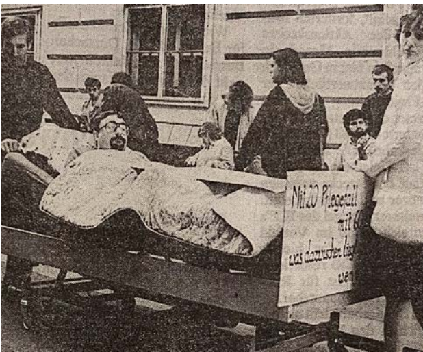
Protestaktion vor dem Finanzministerium 1992

Am 27. Oktober 1992 folgte eine weitere Großdemonstration am Ballhausplatz vor dem Bundeskanzleramt. Diese strategisch vorbereiteten