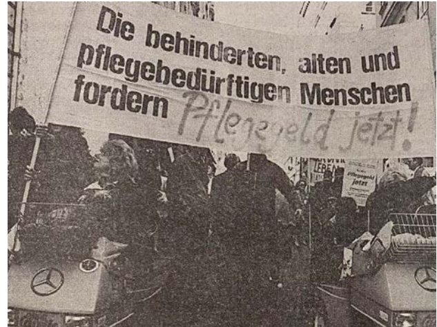
Protestaktion vor dem Finanzministerium 1992

Demonstrationen signalisierten erstmals öffentlich die Geschlossenheit der Behindertenverbände unter dem Dach der ÖAR.