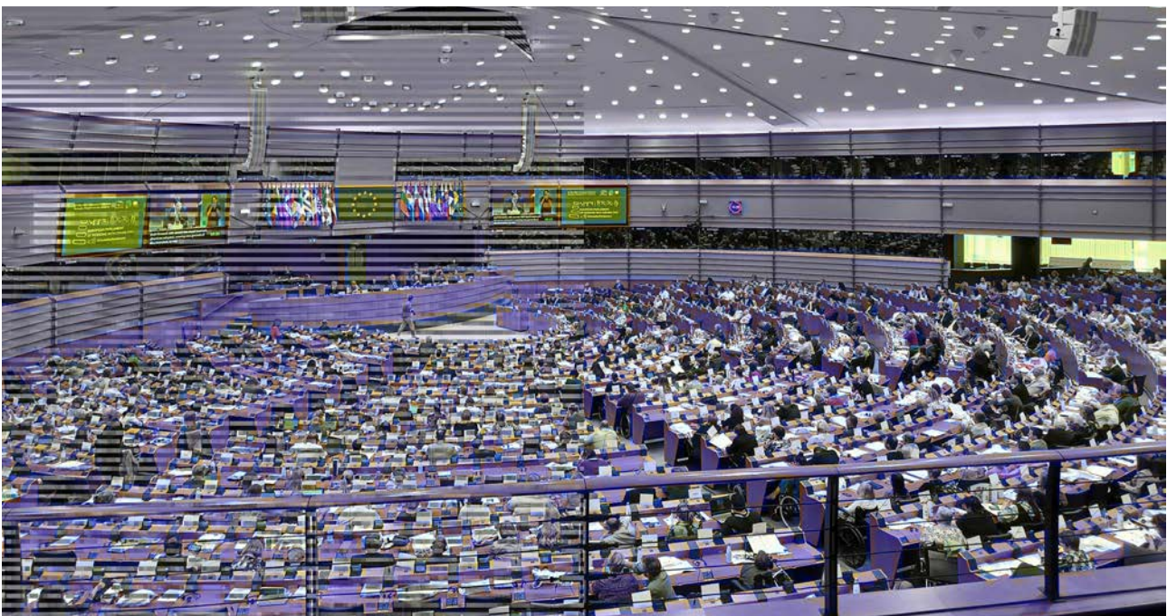
Europäisches Parlament der Menschen mit Behinderungen: 700 Delegierte im Plenarsaal des Europäischen Parlaments im Mai 2023.