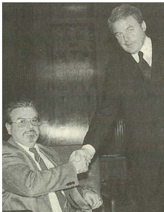
Bundeskanzler Dr. Franz Vranitzky empfängt ÖAR-Präsident Klaus Voget die Pflegegeld-Forderung betreffend. Dies ist ein Moment, der den Einzug der Behindertenpolitik in die höchsten Ebenen der Republik markiert.

Das Bundespflegegeldgesetz war das erste große sozialpolitische Gesetz, das maßgeblich auf die Initiative der organisierten Behindertenbewegung zurückging. Der Einfluss der ÖAR war in diesem Prozess deutlich erkennbar. Die Organisation koordinierte Positionen, brachte fachliche Tiefe ein und sorgte für die notwendige politische Geschlossenheit der Behindertenverbände.