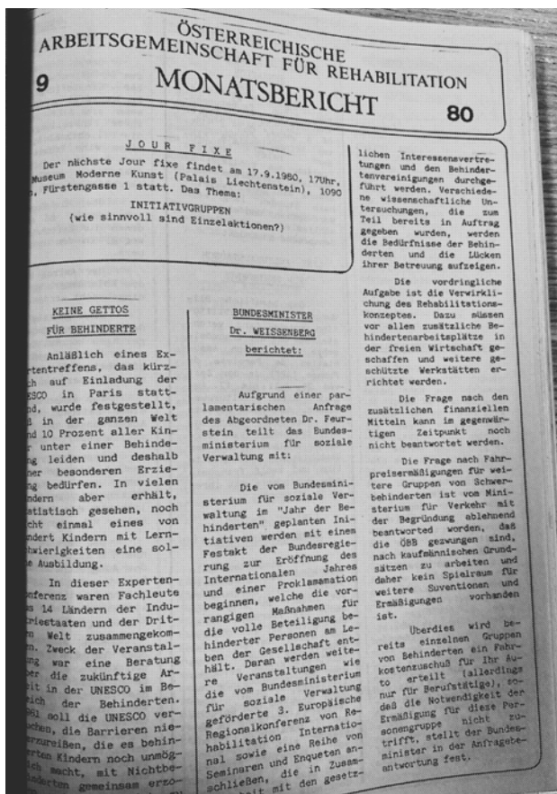
Scan des „Monatsberichts“ Nummer 9/1980