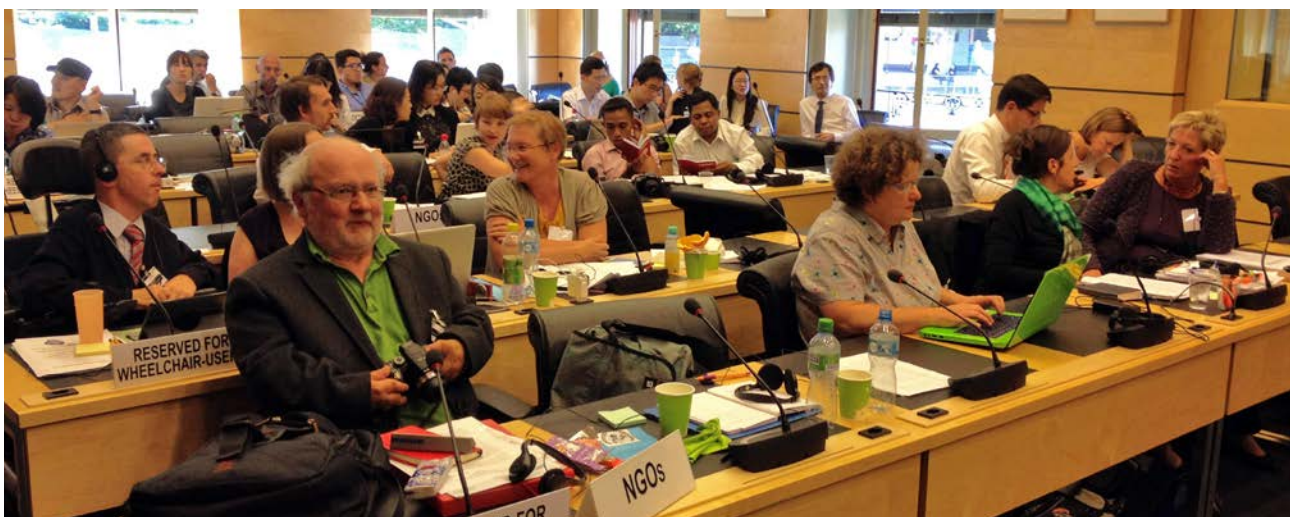
Personen aus zivilgesellschaftlichen Organisationen bei der Staatenprüfung in Genf.

Zur Überwachung der Umsetzung wurde ein Unabhängiger Monitoringausschuss eingerichtet. Die ÖAR erhielt die Aufgabe, Mitglieder für dieses Gremium vorzuschlagen, wodurch eine institutionalisierte Verbindung zwischen der organisierten Zivilgesellschaft und der menschenrechtlichen Kontrolle entstand. In dieser Zeit wandelte sich der Dachverband von der nationalen Lobbyorganisation zu einer Akteurin im internationalen Menschenrechtssystem.